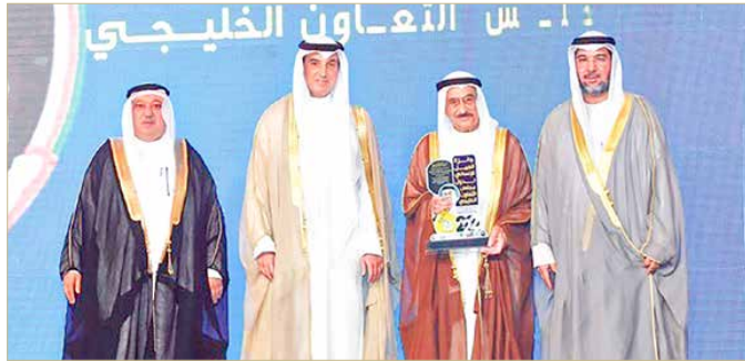
المنامة - المجلس الأعلى للصحة

تحت رعاية كريمة من وزير الخارجية بدولة الكويت الشقيقة الشيخ أحمد ناصر محمد الصباح وبحضور خليجي وعربي رفيع المستوى تم تكريم رئيس المجلس الأعلى للصحة الفريق طبيب الشيخ محمد بن عبدالله آل خليفة في حفل الدورة السادسة لجائزة العمل الإنساني للعام 2022 التي أقيمت بالتوازي مع القمة الخليجية للعمل الإنساني في دولة الكويت الشقيقة، والتي تنظم سنوياً لتكريم نخبة من البارزين في مجالات العمل الإنساني على الصعيدين الإقليمي والدولي.