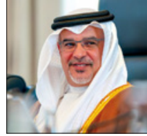
مشروع «مساري» لصلح مهارات الشباب وتنمية مواهبهم.. مجلس الوزراء