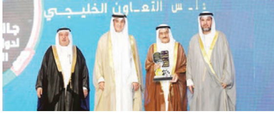
○ جانب من التكريم.

تحت رعاية كريمة من الشيخ أحمد ناصر محمد الصباح وزير الخارجية بدولة الكويت الشقيقة، وبحضور خليجي وعربي رفيع المستوى تم تكريم الفريق طبيب الشيخ محمد بن عبدالله آل خليفة رئيس المجلس الأعلى للصحة في حفل الدورة السادسة لجائزة العمل الإنساني للعام ٢٠٢٢ التي أقيمت بالتوازي مع القمة الخليجية للعمل الإنساني في دولة الكويت الشقيقة، والتي تنظم سنوياً لتكريم نخبة من البارزين في مجالات العمل الإنساني على الصعيدين الإقليمي والدولي.