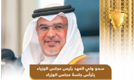
سمو ولي العهد رئيس مجلس الوزراء يتأخر جلسة مجلس الوزراء 16 مايو 2022